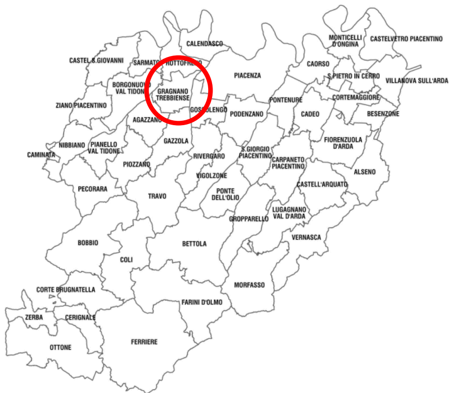
Figura 2.1 – Ubicazione del Comune di Gragnano Trebbiense nel territorio della Provincia di Parma.