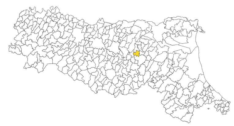
Tavola 7a - FA0.1-0.5s

Regione Emilia-Romagna Comune di Calderara di Reno