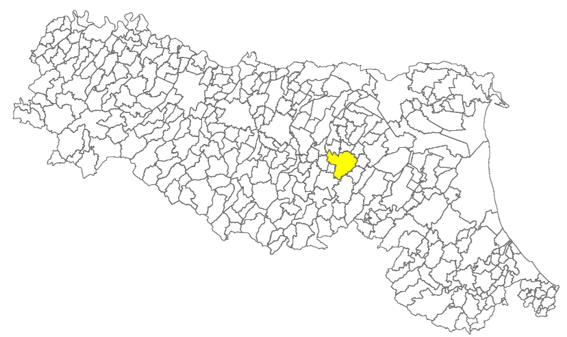
Tavola 12a - H SM

Regione Emilia-Romagna Comune di Grizzana Morandi