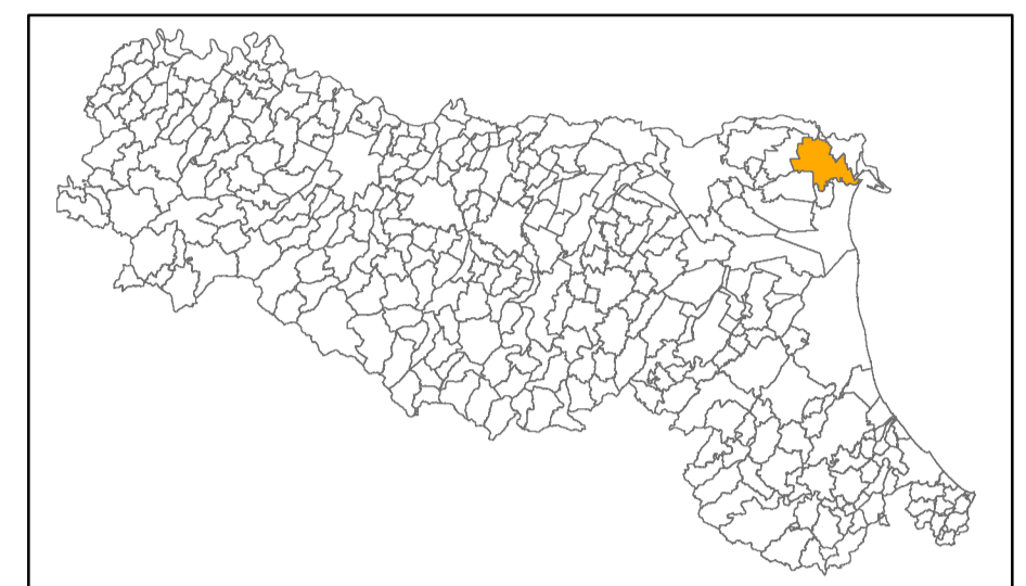
Tavola F3 - PGA

Regione Emilia-Romagna Comune di Codigoro