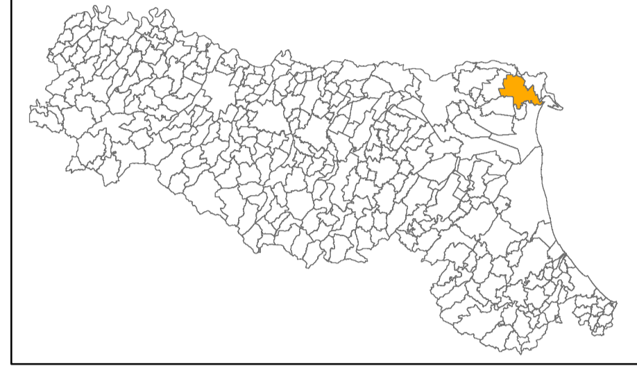
Tavola N4 - SI2

Regione Emilia-Romagna Comune di Codigoro