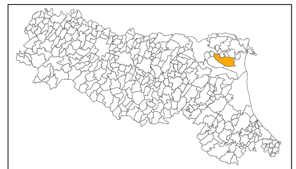
Tavola 6c - Fa PGA

Regione Emilia-Romagna Unione Valli e Delizie Comune di Ostellato