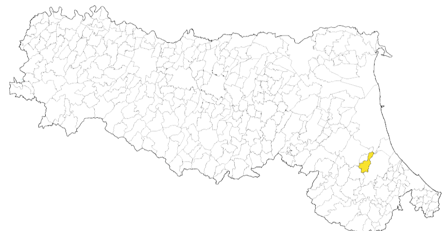
Tav. 2 - Capoluogo, Fratta Terme

Regione Emilia-Romagna Comune di Bertinoro