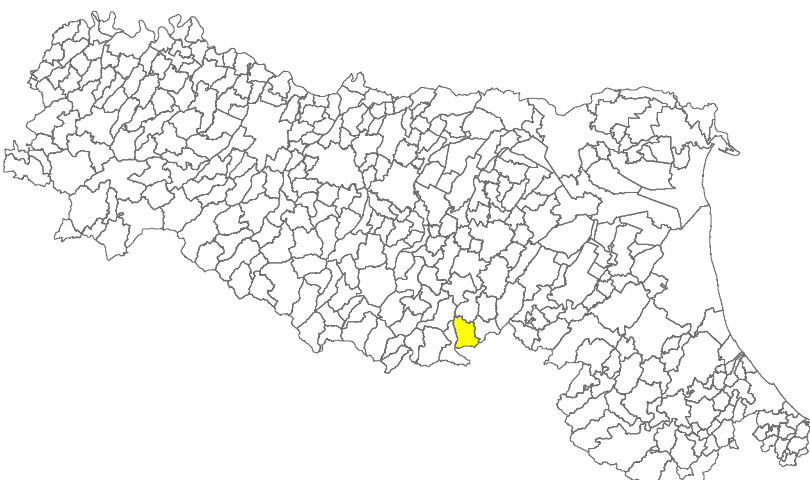
Tavola 14b – H SM

Regione Emilia–Romagna Comune di San Benedetto Val di Sambro